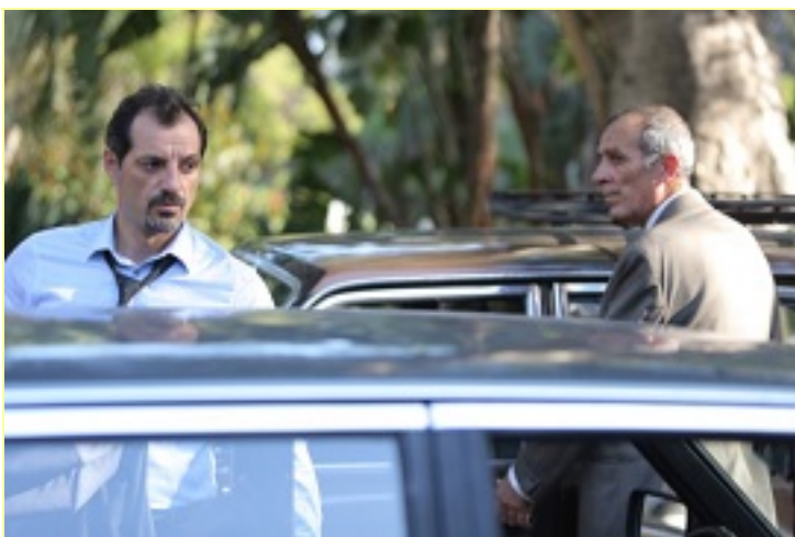
Una scena del film "L'Insulto"

"L'insulto" (L'Insulte) per la sceneggiatura di Ziad Doueiri e Joëlle Touma vince il 37° Premio internazionale alla migliore sceneggiatura "Sergio Amidei" .