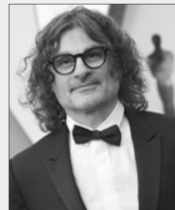
Režiser Ziad Doueiri

ZMAGOVALEC Ziad Doueiri: »Z nagradami so bitke lažje«